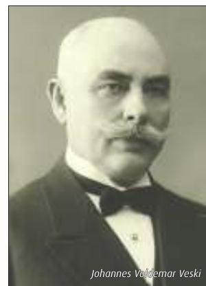
Johannes Voldemar Veski