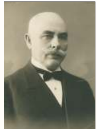
Johannes Valdemar Veski.