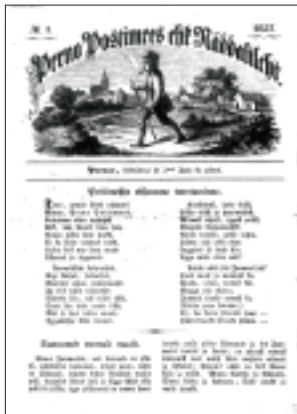
J. V. Jannseni Perno Postimehe esimese numbril esiküljel.