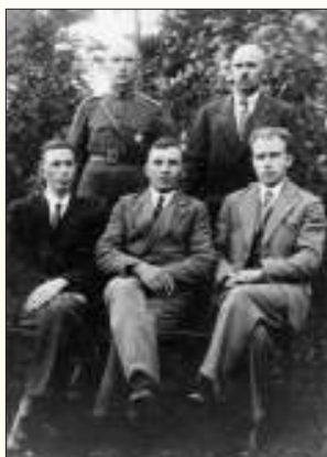
Aakre vallaametnikud. 1930.

Eesti keel jõudis esimeste kirjapanekuteni 1220. aastatel, mil Henriku Liivimaa kroonikas pandi kirja esimesed eestikeelsed nimed, sõnad ja laused. Alles 1520. aastatel sündisid esimesed sidusad eestikeelsed tekstid: meieisapalve, Ave Maria ja usutunnistus, mis leiduvad Kullamaa kiriku vakuraamatu lõpus. Umbes samal ajal ilmusid ka esimesed eestikeelsed trükiteosed; needki olid usutekstid. 16. saj jooksul kujunesid kaks eesti kirjakeelt, tallinna ja tartu keel. Kumbki käibis Eesti ala eri osades kõrvuti peaaegu neli sajandit.